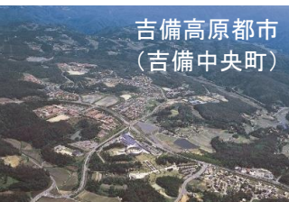
吉備高原都市 (吉備中央町)