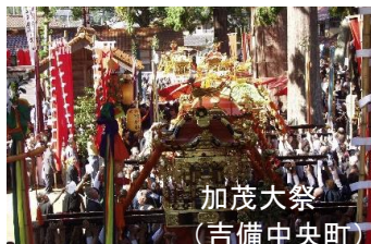
加茂大祭 (吉備中央町)