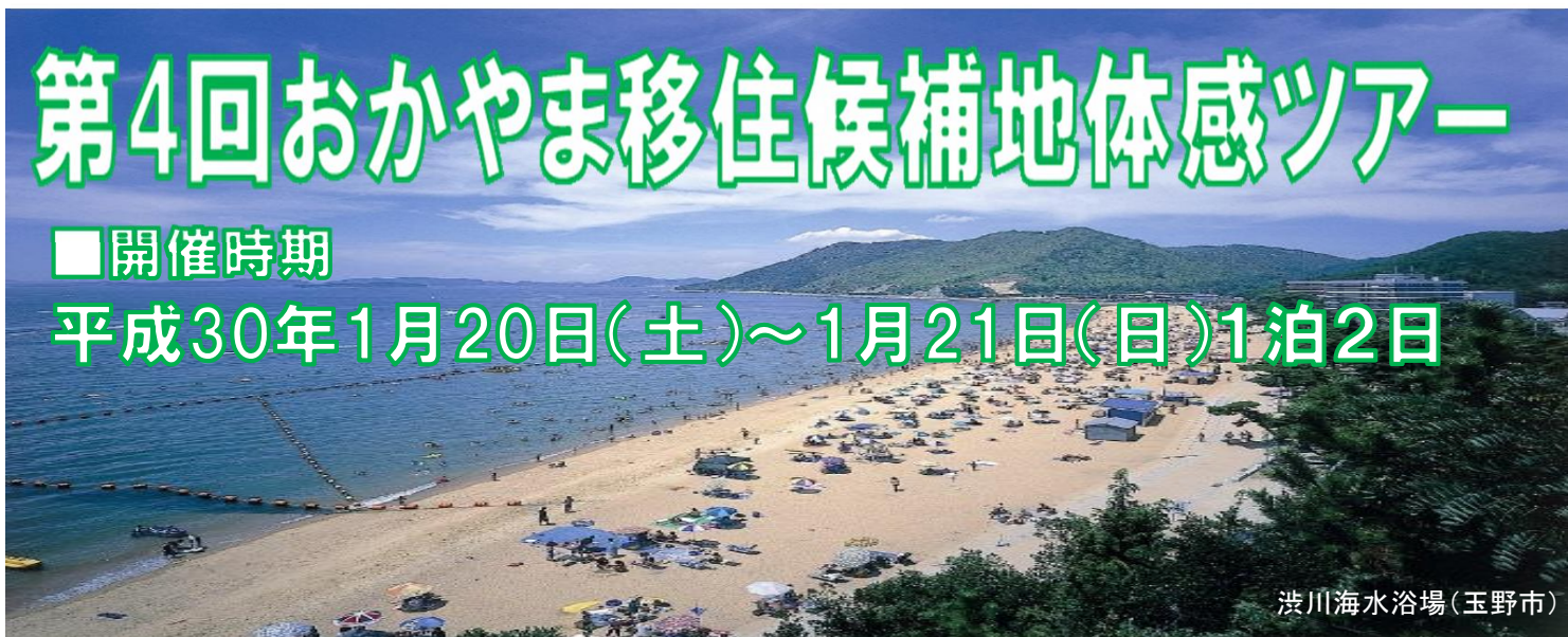
渋川海水浴場(玉野市)