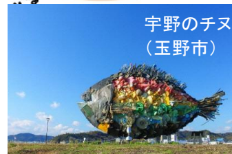
宇野のチヌ (玉野市)