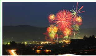
岡山県 金時まつり