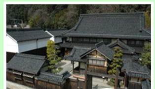
鳥取県 石谷家住宅